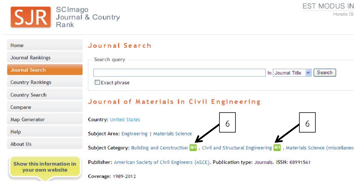
รูปที่ 4 ค่า Quartile score (Q) ใน SJR (SCImago Journal & Country Rank)

จากรูปที่ 3 เลือกคลิกที่หมายเลข 5 ตรงชื่อวารสารที่ต้องการทราบค่า Quartile (Q) จะปรากฏค่าของ Quartile score (Q) ตามรูปที่ 4 เช่น ในที่นี้ ได้ Q1 ดังหมายเลข 6 ใน