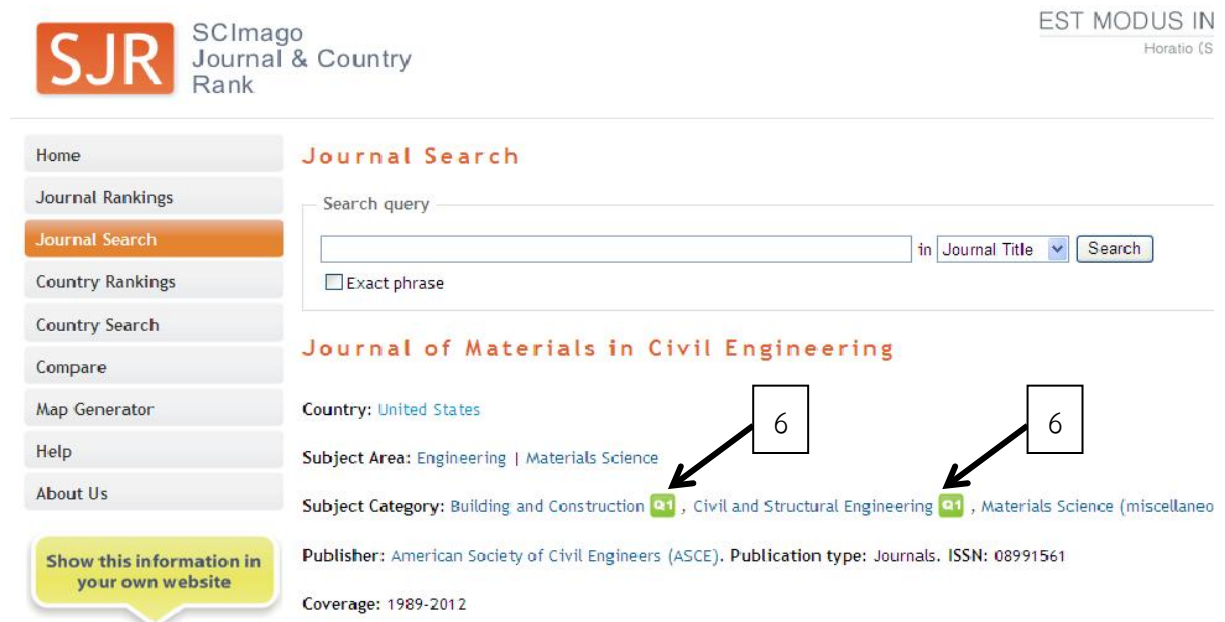
รูปที่ 4 ค่า Quartile score (Q) ใน SJR (SCImago Journal & Country Rank)

จากรูปที่ 3 เลือกคลิกที่หมายเลข 5 ตรงชื่อวารสารที่ต้องการทราบค่า Quartile (Q) จะปรากฏค่าของ Quartile score (Q) ตามรูปที่ 4 เช่น ในที่นี้ ได้ Q1 ดังหมายเลข 6 ใน