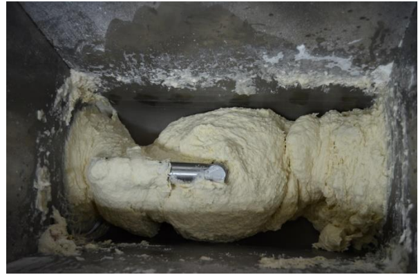
เครื่องบดเครื่องเทศ